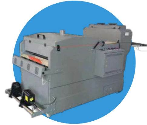
Aplicación de POLVO y Secado de polvo