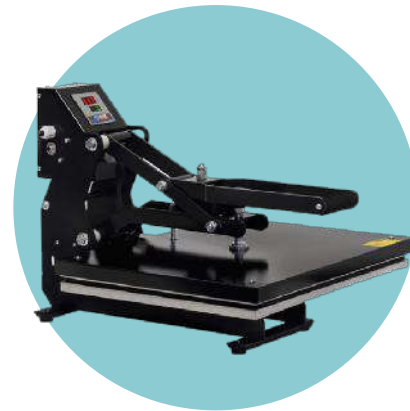
Transferencia con Plancha