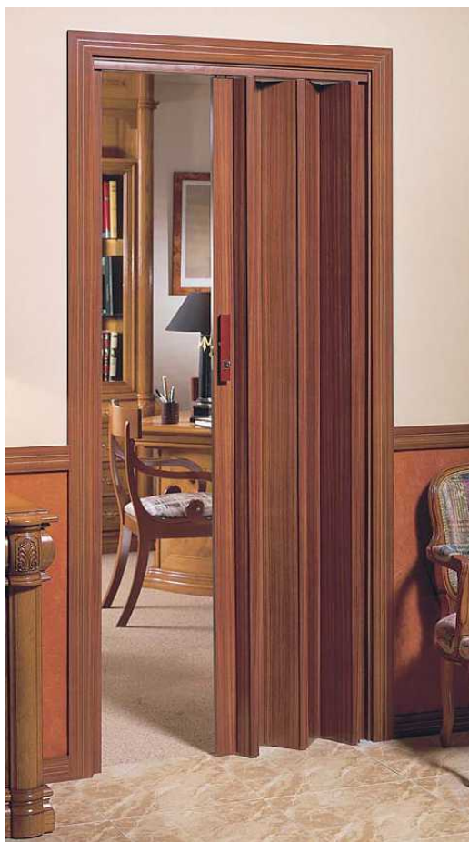
Puerta de apertura lateral con cierre de llave

Puerta plegable de p.v.c. con Film vinílico de propiedades excelentes, que consiguen darle un tacto muy agradable y sedoso