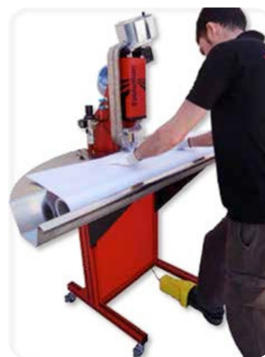
Mesa opcional con bandeja inoxidable