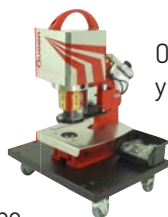
Opcional: Bandeja con ruedas y cajas de almacenamiento