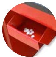
Corte de material