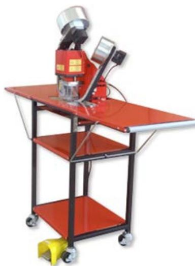
Opcional mesa con alas abatibles