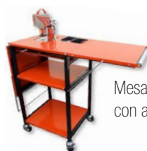
Mesa opcional con alas abatibles