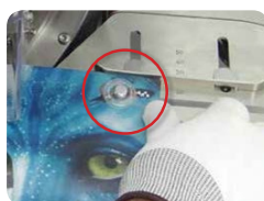
Guía de posicionamiento