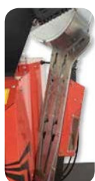
Doble dispensador de arandelas