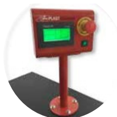
Panel de control