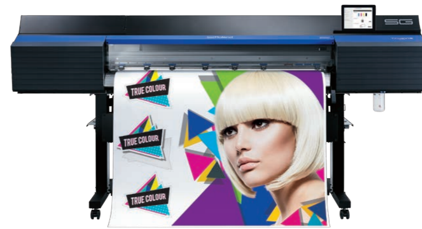
SG-540 (1.371 mm de ancho)

Tanto si acaba de iniciar su negocio como si lo que desea es ampliar la producción, la serie TrueVIS SG puede ayudarle a alcanzar sus objetivos.