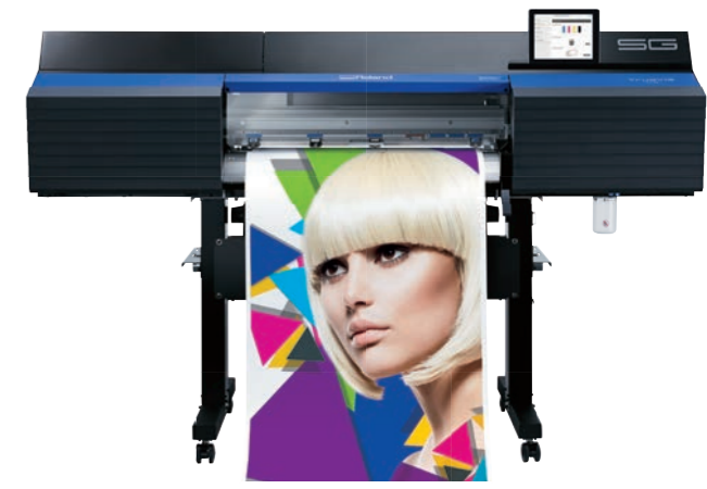
SG-300 (762 mm de ancho)